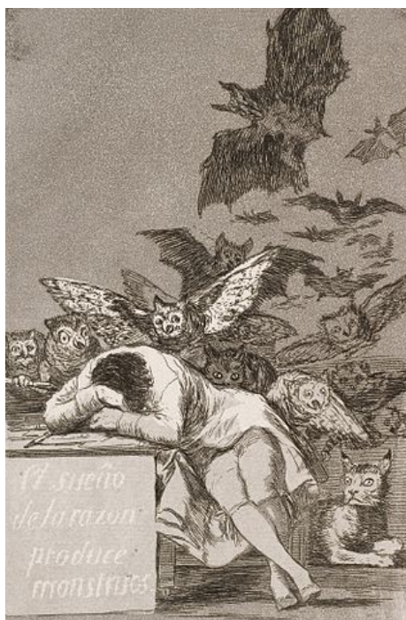
Francisco de Goya, El sueño de la razón produce monstruos , grabado n.º 43 Serie Los Caprichos (1797-1799).

Estas contradicciones llevaron a luchas, guerras e invasiones que desafiaron los ideales ilustrados de libertad, igualdad y fraternidad. Por ejemplo, las guerras e invasiones napoleónicas, que se llevaron a cabo en nombre de la razón y la libertad, causaron sufrimiento y destrucción en muchas partes de Europa. Por lo tanto, es importante reconocer tanto los logros como las limitaciones de la Ilustración para comprender su legado y sus implicaciones en la sociedad contemporánea.