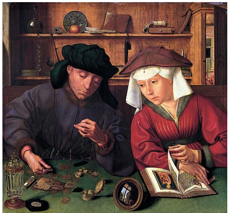
Quentin Massys, El cambista y su mujer (1515).

El surgimiento de la burguesía como clase social es un fenómeno histórico que se desarrolló a lo largo de la Edad Moderna . El concepto proviene de aquellos individuos que desarrollaban su actividad en las ciudades (o burgos). Según Revueltas (1990), la burguesía se consolidó junto con el proceso global de acumulación, en medio de luchas y enfrentamientos contra la nobleza y el sistema feudal, lo que le confirió un papel activo y revolucionario.