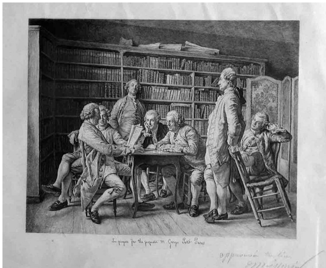
Louis Monziès, Lecture chez Diderot (Grabado)